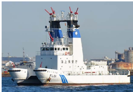
第三管区海上保安本部 ひりゅう