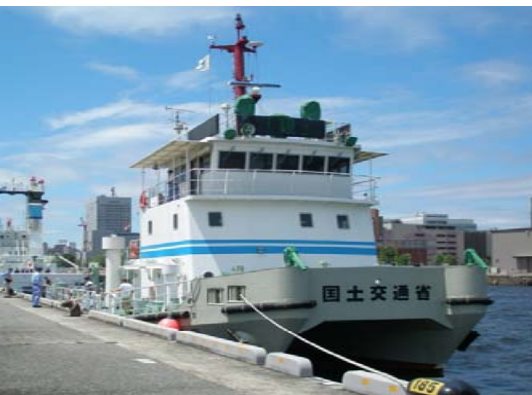
国土交通省 べいくりん