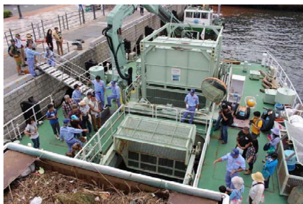
特別行事「きれいな海をまもる船 大公開 in 横浜港」（平成28年度実施状況）