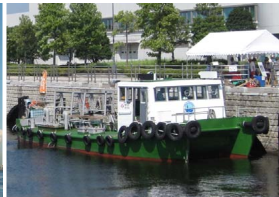
横浜市港湾局 青海丸