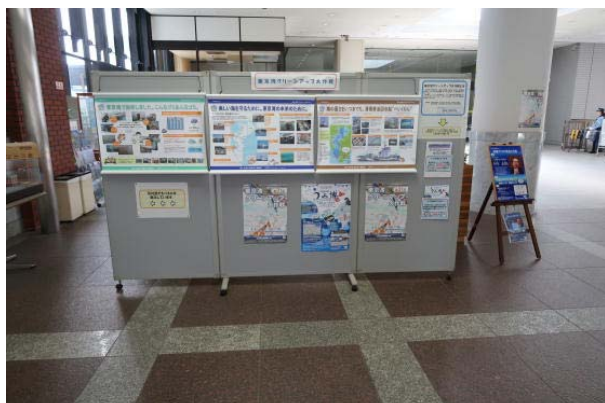
パネル展示（平成28年度実施状況）