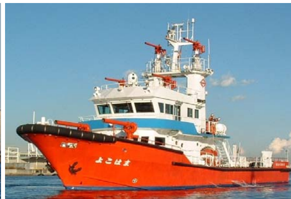
横浜市消防局 よこはま